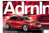
Werbe-Oscar 2009 In Berlin wurde der Effie verliehen