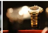
Madoff-Auktion Uhren, Enten, Papier – alles wird versteigert