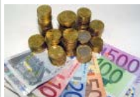
Geldelite Die reichsten Deutschen