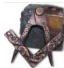
Geheimnisvoll Symbole und Geräte der Freimaurer