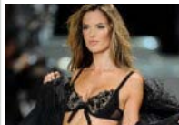
Teure Models Ganz schön reich, die Damen