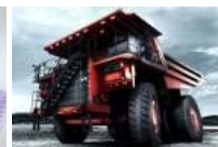
Bagger-Träume Die größten Baumaschinen der Welt